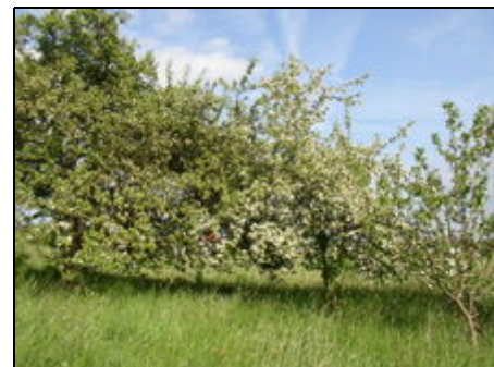
unsere Streuobstwiesen im Frühjahr

Die Ferienwohnungen befinden sich in einem einzeln stehenden Gebäude in der Dorfmitte von Taxöldern. Das Erholungsgebiet "Oberpfälzer Seenland" ist eine abwechslungsreiche, hügelige Landschaft mit lichten Wäldern, ausgedehnten Wiesen, malerischen Ortschaften und vielen kleinen Seen. Sie können hier gut wandern, Fahrradtouren unternehmen und verschiedene Wassersportarten ausüben. Wir empfehlen Tagesausflüge zu den nahegelegenen Kulturstätten in Schwandorf, Regensburg, Amberg und Prag.